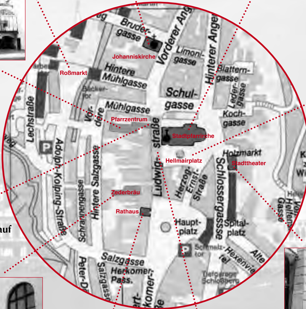
Hellmairplatz Piazza San Marco