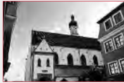
Stadtpfarrkirche Mariä Himmelfahrt San Marco