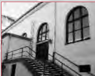
Zederbräu Sala Vivaldi