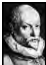
Orlando di Lasso

Orlando di Lasso ist als Vertreter der Madrigalkunst besonders hervorzuheben, auch als wahrhaft europäischer Geist. Franko-flämischer Abstammung, kam er schon als Jugendlicher an den Hof des Königs von Sizilien, lebte später in Mailand, Neapel und Rom, bereiste England, Frankreich und die Niederlande. 1556 berief ihn Herzog Albrecht V. von Bayern an die Münchener Hofkapelle, deren Leitung er bis zu seinem Tod 1594 behielt. Orlando di Lasso war einer der produktivsten Komponisten überhaupt: Mehr als 2000 Werke hat er hinterlassen, v.a. geistliche Motetten, italienische Madrigale, französische Chansons, deutsche Lieder und lateinische Huldigungswerke. Einer seiner Schüler war Gabrieli, womit sich unser Blick nun nach Venedig richtet.