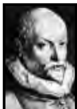
Orlando di Lasso

Orlando di Lasso ist als Vertreter der Madrigalkunst besonders hervorzuheben, auch als wahrhaft europäischer Geist. Franko-flämischer Abstammung, kam er schon als Jugendlicher an den Hof des Königs von Sizilien, lebte später in Mailand, Neapel und Rom, bereiste England, Frankreich und die Niederlande. 1556 berief ihn Herzog Albrecht V. von Bayern an die Münchener Hofkapelle, deren Leitung er bis zu seinem Tod 1594 behielt. Orlando di Lasso war einer der produktivsten Komponisten überhaupt: Mehr als 2000 Werke hat er hinterlassen, v.a. geistliche Motetten, italienische Madrigale, französische Chansons, deutsche Lieder und lateinische Huldigungswerke. Einer seiner Schüler war Gabrieli, womit sich unser Blick nun nach Venedig richtet.