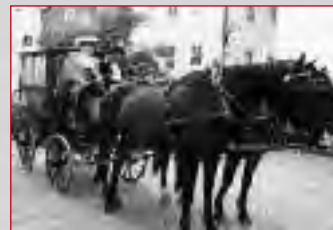
Fußgängerzone Ludwigstraße Informationsstand Programmhefte Kutschfahrten