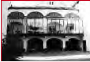
Pfarzentrum Sala Rossini Cortile Verdi Sala Paganini