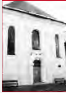
Johanniskirche Capella Sistina