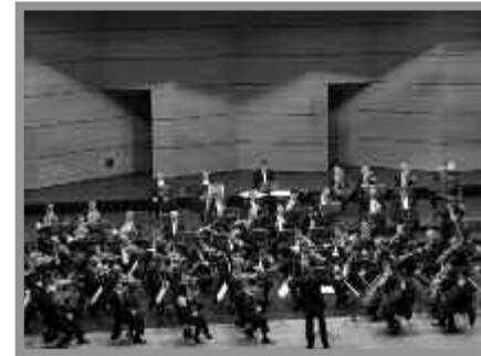
Orchester „Symphony Prag“