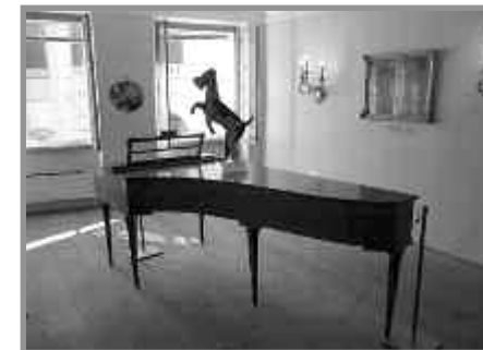
Hammerflügel in Mozarts Geburtshaus