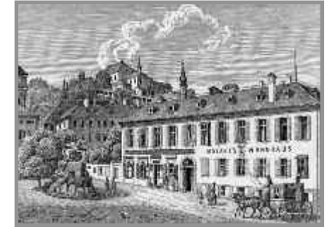
Mozarts Wohnhaus in Salzburg

beiden Wunderkindern nicht wie gewöhnliche fahrende Musikanten reisen, sondern „nobl oder cavaglierment“ bei den ersten Adressen Europas vorfahren, die er zu besuchen gedachte.