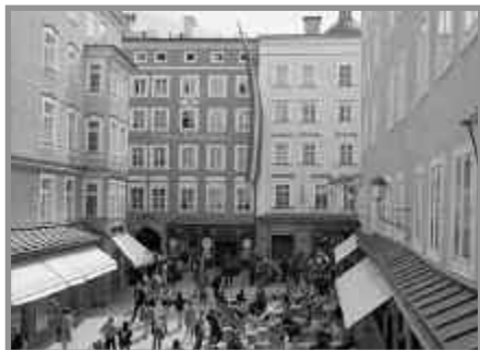
Mozarts Geburtshaus in Salzburg

Es gibt praktisch keine musikalische Gattung, die Mozart nicht mit seinen Kompositionen bereichert hätte. Auch in den dreißig Einzelkonzerten zeigt unsere „Mozart-Nacht“ nur