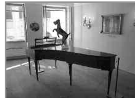
Hammerflügel in Mozarts Geburtshaus