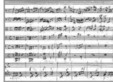
Faksimile des „Exsultate“

„Denn könnt ich jedem Musikfreunde, besonders aber den Großen, die unnachahmlichen Arbeiten Mozarts, so tief und mit einem solchen musikalischen Verstande, mit einer so großen Empfindung in die Seele prägen, als ich sie begreife und empfinde: so würden die Nationen wetteifern, ein solches Kleinod in ihren Ringmauern zu besitzen. Mich zürnet es, dass dieser einzige Mozart noch nicht bey einem kaiserlichen oder königlichen Hofe engagiert ist. Verzeihen Sie, wenn ich aus dem Geleise komme: Ich habe den Mann zu lieb!“ Nicht zuletzt war Mozart offenbar völlig unfähig, sich selbst zu vermarkten. So wuchs paradoxerweise mit seinem Ruhm auch sein Schuldenberg. Trotz alledem arbeitete er wie