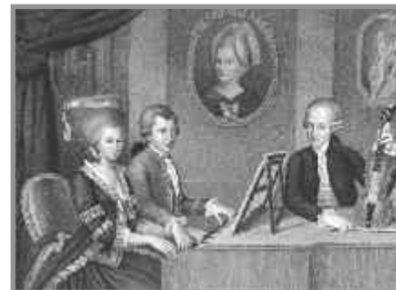
Nannerl, Wolfgang und Leopold Mozart