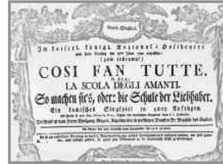
Deckblatt zur Oper „Così fan tutte“