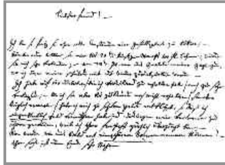
Faksimile eines Briefes von Mozart