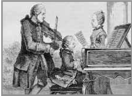
Mozart am Klavier mit Vater und Schwester