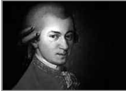
Wolfgang Amadeus Mozart auf einem posthumen Porträt von Barbara Krafft

hin zu den großen Missae solemnes –, außerdem Vespers, Litaneien, Motetten, Oratorien, Kantaten, Chorsätze mit und ohne Orchesterbegleitung, Kirchenlieder, sowie – als letztes und legendenumwobenes Werk – das unvollendete Requiem. Neben dieser Vielzahl von geistlichen Gesangswerken stehen die Instrumentalstücke für den kirchlichen Gebrauch, allen voran die Kirchensonaten, kleine, reizende Miniaturen.