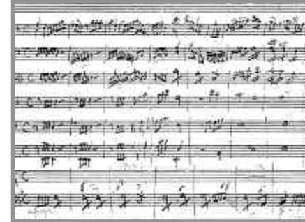
Faksimile des „Exsultate“

„Denn könnt ich jedem Musikfreunde, besonders aber den Großen, die unnachahmlichen Arbeiten Mozarts, so tief und mit einem solchen musikalischen Verstande, mit einer so großen Empfindung in die Seele prägen, als ich sie begreife und empfinde: so würden die Nationen wetteifern, ein solches Kleinod in ihren Ringmauern zu besitzen. Mich zürnet es, dass dieser einzige Mozart noch nicht bey einem kaiserlichen oder königlichen Hofe engagiert ist. Verzeihen Sie, wenn ich aus dem Geleise komme: Ich habe den Mann zu lieb!“ Nicht zuletzt war Mozart offenbar völlig unfähig, sich selbst zu vermarkten. So wuchs paradoxerweise mit seinem Ruhm auch sein Schuldenberg. Trotz alledem arbeitete er wie