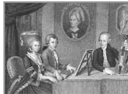
Nannerl, Wolfgang und Leopold Mozart